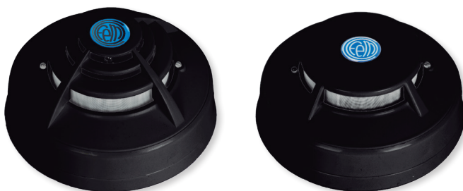
Otros colores, bajo petición