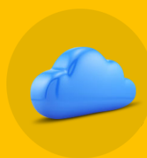
Conexão via nuvem