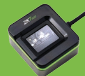
Requiere enrolador SLK20R